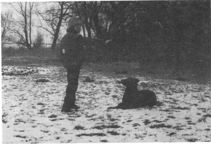
J A N U S & B E A U T Y