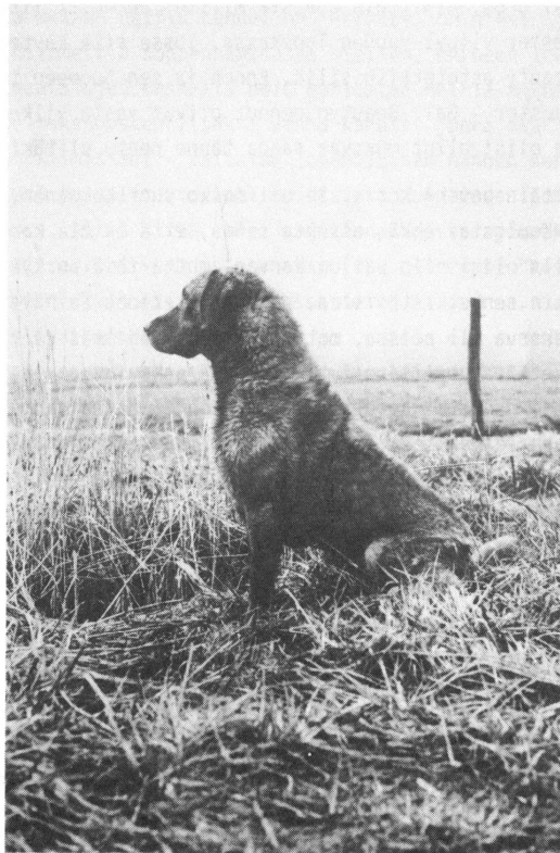
D O N A L D