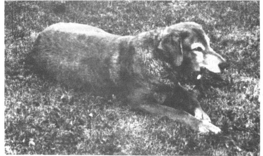
Eulalia av Komsalö 10 v.

Sairauden toisessa ja vielä kolmannesakin vaiheessa voimme merkittävästi helpottaa koiran oloa syöttämällä sille munuaisvikaa varten tarkoitettuja dieettiruokia. Erilaisista vaihtoehdoista sopivin valitaan virtsa- ja verinäytteiden tulosten perusteella. Näitä dieettiruokia saa ainoastaan eläinlääkäreiden kautta, mikä tekee niiden hankinnan hiukan hankalaksi.