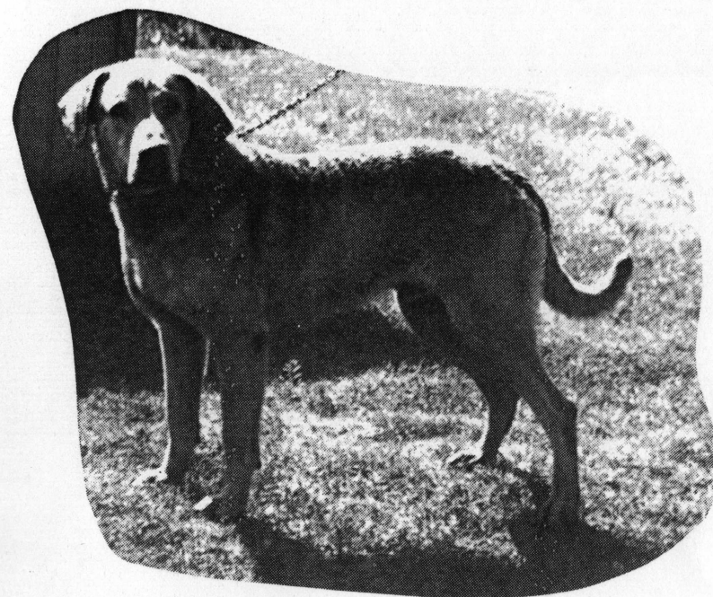
JUNNU 9-VUOTIAS 1.6.92 (Arctic Goose av Komsalö)

JUN 1/2 kp Fredrika av Komsalö (vanh. kts ed.) om. Anita Soinjoki