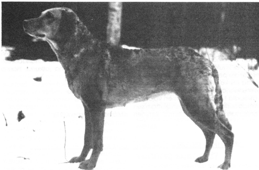
Uusi Suomen muotovalio: HIGH NOON SIERRA SADIE