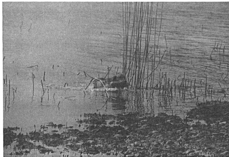
SAARA TYÖSSÄ ANGELNIEMESSÄ

Harjoitusten aikana huomattiin jälleen kerran, että ohjaajat jostain syystä unohtavat sen tärkeimmän harjoitteluvaiheen: YHTEISTYÖN. Koiraan on saatava hyvä kontakti ennen kuin siirrytään muihin harjoituksiin, muuten kaikki on pelkkää ajan hukkaa. Ellei koiralla ole aikomustakaan kuunnella ohjaajan käskyjä, on aivan turha aloittaa harjoittelua riistalla tai dummylla. Hassuinta on, että jokainen koiraansa kouluttava tietää oikein hyvin ettei se kuuntele takapuolellaan, vaan siihen tulisi saada silmäkontakti. Tästä huolimatta useimmat ohjaajat - ainakin tällaisissa koulutustilaisuuksissa - jättävät yhteistyöharjoittelun aivan liian vähälle. Ehkäpä monella meistä on kiire päästä tositoimiin. Noutamaanhan chessiemme on luotu, mutta hosumalla aiheutamme enemmän vahinkoa kuin hyötyä. Chessie on itsenäinen ja älykäs koira, joka nopeasti ottaa johdon kaikissa elämän tilanteissa ellei omistaja pideä varaansa. Toisaalta chessie on erittäin miellyttämishaluinen, joten tätä ominaisuutta meidän tulisi muistaa käyttää enemmän hyväksemme.