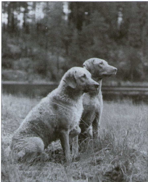
Koirat kuin heinät