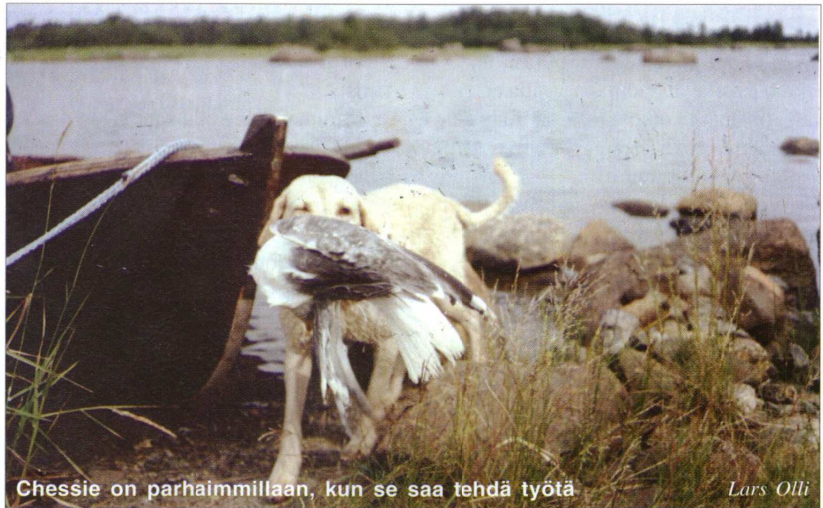
Chessie on parhaimmillaan, kun se saa tehdä työtä

Chesapeakekahdenoutaja ei ole oikea rotu niin sanotuille machomiehille tai naisille. -Minä en suostu edes harkitsemaan pennun myymistä tämän kaltaiselle ihmistyyppille. Minusta tuntuu kuitenkin ettei täällä Suomessa ole sellaisia kouluttajia kuin meillä kotona USA:ssa on. He yrittävät kouluttaa chessieitä olemalla kova niitä kohtaan. Mitä kovempia otteita kouluttajat käyttävät, sitä kovemmaksi chessiet muuttuvat. Se on hyvin surullista nähtävää, sillä koiran ja ohjaajan välille ei koskaan voi syntyä