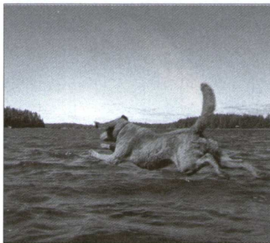
Yankee rakastaa vettä yli kaiken kunnan chessien tapaan

- Luonteesta haluaisin keskustella pitkään, sanoi Millie. – On tärkeää oppia ymmärtämään tätä rotua. Chesapeakekelahdennoutaja on mielestäni erilainen luonteeltaan kuin mikään muu koirarotu ja se on varsinkin erilainen kuin muut noutajat. Väärin käsiteltyinä siitä voi tulla vaikeasti hallittava – tätä jotkut ihmiset sanovat kovapäisyysdeksi.