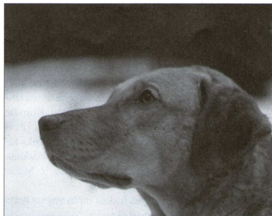
High Noon Sierra Sadiella on kaunis pää

Pää muodostaa tylpän kolmion, se ei saa olla laatikkomainen. Leikkimielisesti sanottuna sen tulee olla sellainen, että siihen mahtuu isot aivot!