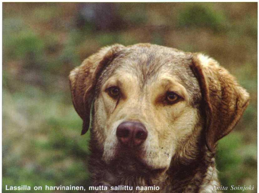
Lassilla on harvinainen, mutta sallittu naamio