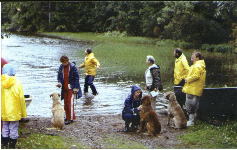
Noutoharjoituksia Chessietreffeillä vuonna -85