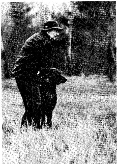
DAN JA BREAKERS